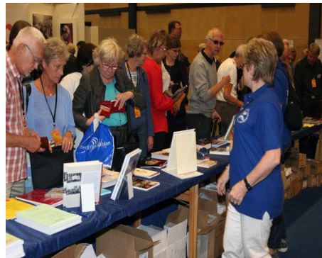
Rötters bokbord med böcker, broschyrer, DVD skivor mm, lockade många att lyfta på plånboken.