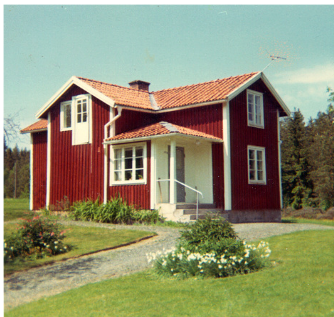
Ett torp från slutet av 1800-talet Hällefors.

Medlemstidning för DIS-Nord Årg. 6 nr 2 2010