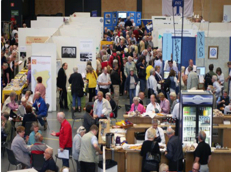
Över 100 utställare och många besökare.