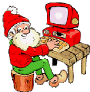
Text och foto: Lennart Andersson